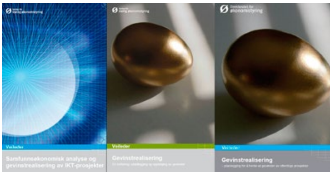
Et utvalg av veiledere fra DFØ i tidsrommet 2006–2014 som handler om gevinstrealisering.

Difi benytter undersøkelsen IT i praksis til blant annet å kartlegge bruken og den opplevde nytten av Prosjektveiviseren. 21 statlige virksomheter svarte i IT i praksis 2013 at Prosjektveiviseren brukes, og at den vil bli brukt framover. Flertallet (17 av 21) av disse virksomhetene opplever den som nyttig for virksomheten. Oppdaterte tall for 2014 viser omtrent det samme.