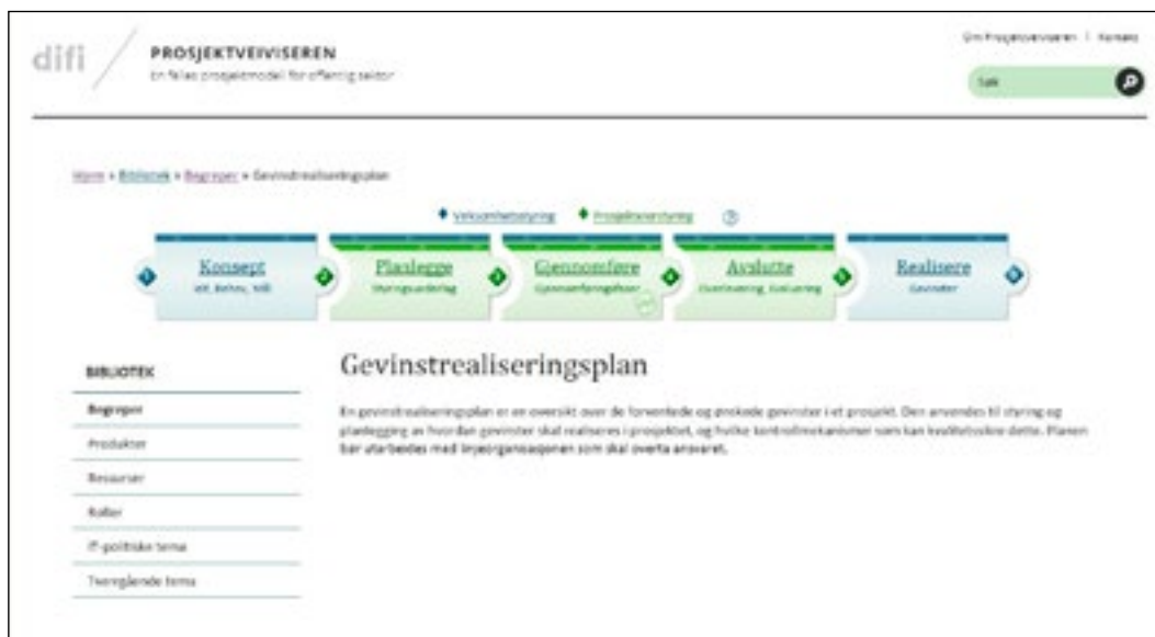
Beskrivelse av gevinstrealiseringsplan i Difis Prosjektveiviser versjon 2.4 2015.

Når det gjelder Prosjektveiviseren, har Difi egne kurs og e-læring. Videre arrangeres det nettverkssamlinger blant virksomheter som har pågående eller planlegger å starte ikt-prosjekter. Difi anser nettverkene som et av de sentrale virkemidlene knyttet til prosjektgjennomføring og gevinstrealisering (intervju med Difi 2014).